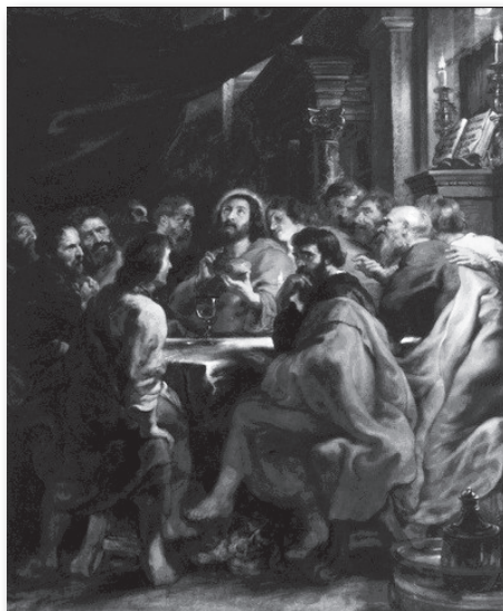
Het Laatste Avondmaal van Rubens uit 1632.

Anderson schetst aan de hand van vroeg-christelijke schrijvers dat het vieren van het avondmaal in de loop van de eeuwen is verschoven naar de morgendienst, waarna de middagdienst een eenvoudige gebedsdienst werd. Hieruit blijkt inderdaad dat houden van