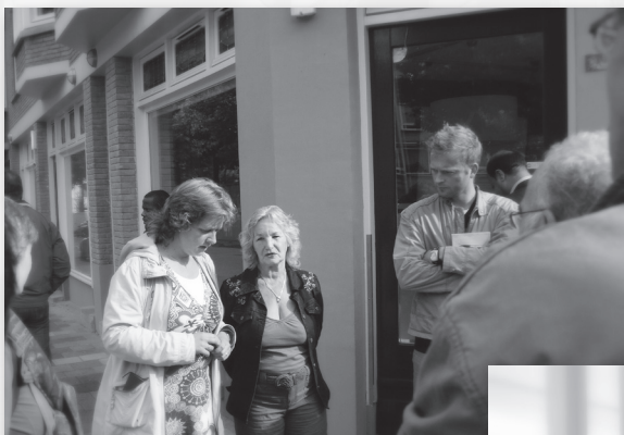
We maken kennis met een aantal mensen uit de wijk.