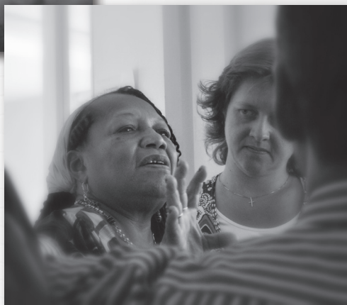
Ontmoeting tussen wijkbewoners is belangrijk voor het versterken van de onderlinge band.