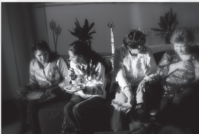
Een multiculturele maaltijd.