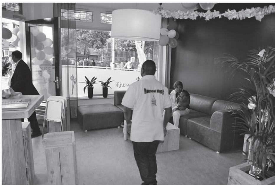
De gezellige woonkamer waar mensen even kunnen binnenlopen.

Naast House of Hope is er ook House of Life. Vaak blijkt er achter maatschappelijke en/of financiële problemen een ander probleem, van emotionele of geestelijke aard, schuil te gaan. Die nood is niet op te lossen met een voedselpakket. Daarom is House of Life, een aparte pastorale activiteit van House of Hope, in het leven geroepen.