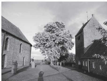
Middeleeuws kerkje (H. Algra).

Uit de gegevens van de Schrift en de kerkgeschiedenis blijkt dus dat meerdere samenkomsten op zondag al lange tijd gebruikelijk zijn. De invulling van die samenkomsten is echter nergens in de Bijbel voorgeschreven en breder dan alleen leerdiensten. Het is vandaag de dag nog steeds de gewoonte dat de middagdienst een leerdienst is. Daar is – zo stelde ik in mijn vorige artikel – nog steeds behoefte aan. Goed onderwijs en toerusting zijn nog steeds erg belangrijk. Het mag dan zo zijn dat dogma's en leer 'uit' zijn, de zaken waar het om gaat zijn dat niet. Zeker, de vragen die de moderne mens stelt, zijn anders dan de vragen van vroeger, maar het blijft een feit dat er altijd vragen zijn. De middagdienst is een bijzondere plek om met de hele gemeente over zulke vragen na te denken in het licht van Gods Woord.