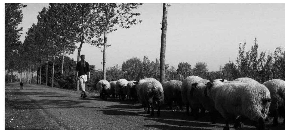
Wat een ambtsdrager doet, is precies wat een herder doet voor zijn kudde: voorop-lopen en richting-geven.

Dat voorop-lopen en richting-geven gebeurt niet of te weinig. Hoe kunnen we met elkaar die situatie veranderen? Wat hebben we nodig om de feitelijke situatie van het ambtelijk functioneren in de kerk steeds dichterbij dat normatieve ideaal te krijgen: ambtsdragers als wegwijzers? Ik ben benieuwd hoe we verder kunnen komen.