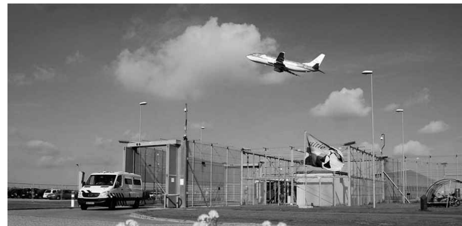
Schiphol heeft een eigen aanmeldcentrum voor asielzoekers die met het vliegtuig naar Nederland komen.

Met de PVV als gedoogpartner is het asielbeleid weer een hot issue. En eerlijk is eerlijk, veel warmte straalt het politieke beleid niet uit. Dat valt zelfs in het buitenland op. Ongetwijfeld heeft dit te maken met het feit dat ook het maatschappelijke klimaat killer is geworden. Mensen lijken steeds negatiever over asielzoekers te oordelen. De vrees voor islamisering is groot. Laat vluchtelingen toch vooral in de eigen regio worden opgevangen. De PVV blijft maar herhalen