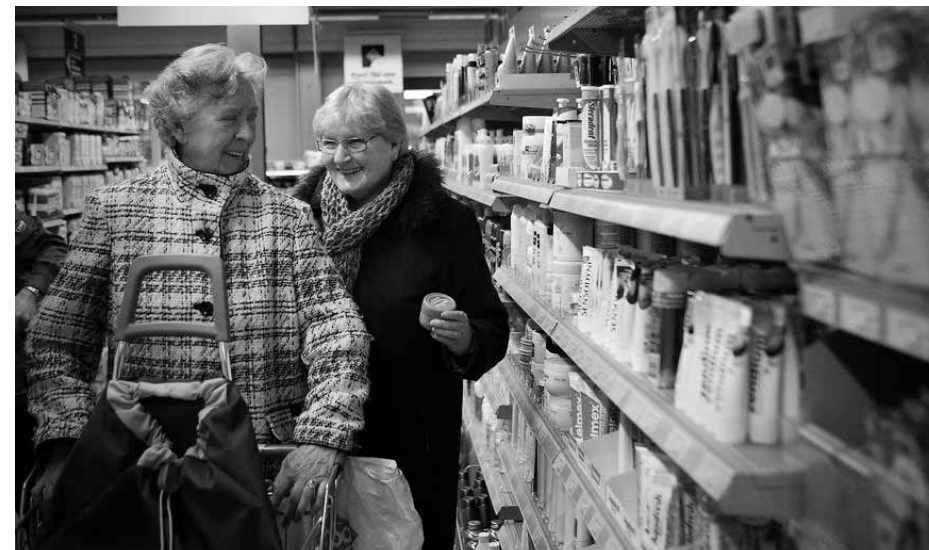
Een voorbeeld van hulp bieden: samen boodschappen doen

komt naar voren dat we als kerk missionair willen zijn. Tegelijk willen we ook elkaar dienen, dat zit in punt twee: met elkaar. We hebben toen als diaconie onze gemeentelieden opgeroepen om zich praktisch en dienend in te zetten. We hebben er voor gekozen