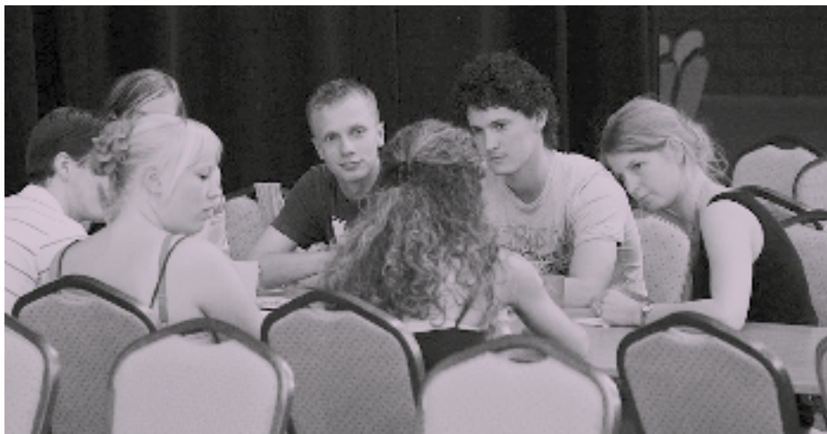
“De studentenvereniging stimuleert me na te denken”

zen over God en mijn relatie met Hem. Als ik maar met God bezig blijf, is het al wat makkelijker om in Hem te geloven. Maar hoe ik Hem nou moet voelen, daar worstel ik nog wel mee.”