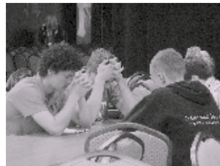
Laten we blijven bidden dat Gods werk zichtbaar wordt op de (gereformeerde) studentenverenigingen