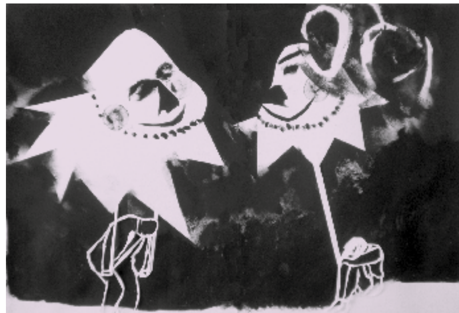
Als je 'masker' een last voor je wordt