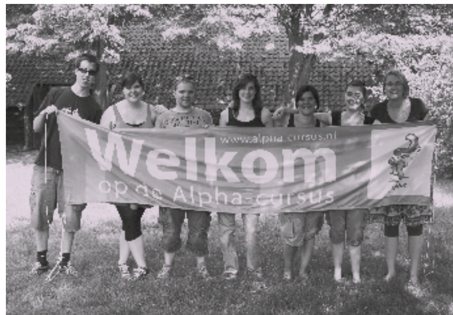
Christelijke Studenten Tilburg (C.S.T.) organiseert samen met IFES StudentAlpha

Het is geen forcerende manier van evangeliseren, maar je mag gewoon zijn wie je bent; je hebt geen sinaasappelkistje en een megafon nodig. Een paar studenten zeggen wel dat ze juist het beantwoorden van die kritische vragen soms moeilijk vinden, maar fo-