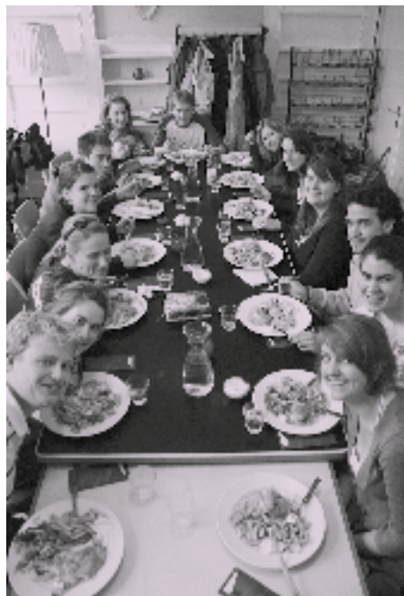
De Alpha-cursus begint zoals gebruikelijk met een gezamenlijke maaltijd

Studentenverenigingen lopen vaak tegen een