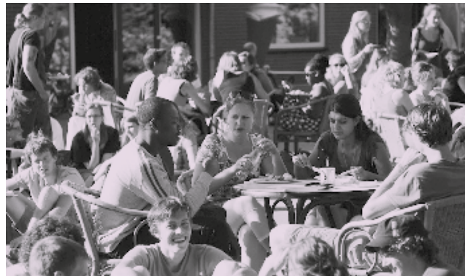
Er zijn zoveel andere leuke dingen zoals studie, studentenvereniging, borrels en feesten met vrienden

Het kan zijn dat God hele andere plannen met je heeft