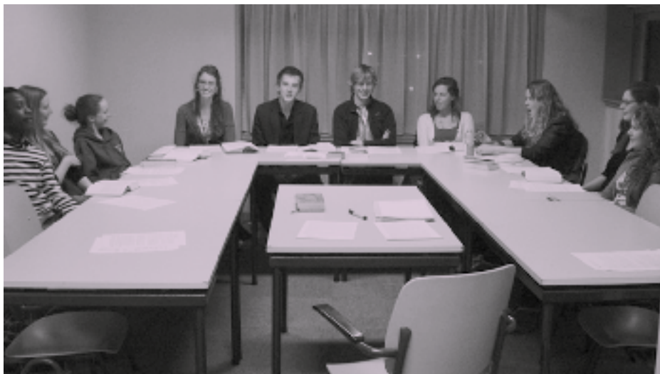
Belijdeniscatechisatie in Groningen

zig is met het geloof. Wat gaat die ouderling doen? Zal hij vermanen? “Hier schrik ik van, Johan. Het valt me erg van je tegen. Ik raad je aan om veel uit de Bijbel te lezen en vooral veel te bidden.” Vaak gaat het ook zo. Wat moet je als ouderling anders?