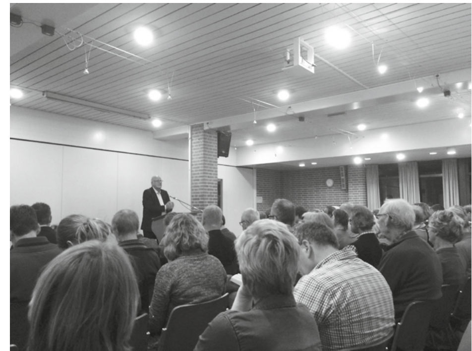
Een leerhuisavond in de CGK Zwolle.

teresseerd is kan contact opnemen via cveren@cgkzwolle.nl .