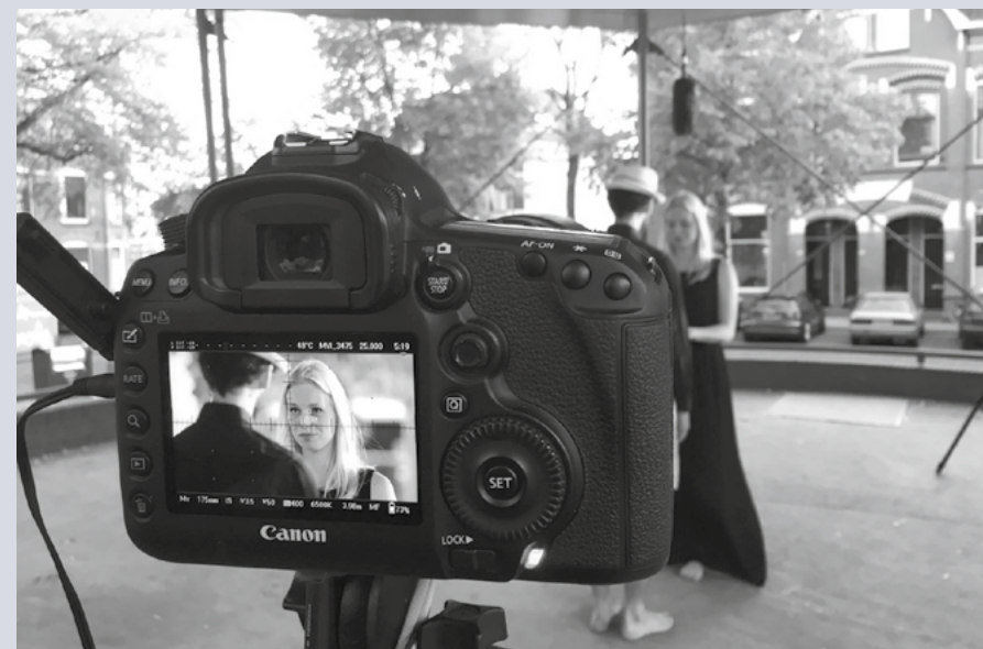
De opname van het filmpje over Hooglied.

Voor kerken die nog geen aanbod voor 18-plussers hebben, is dit materiaal een stimulans om samen met jongeren een kring op te zetten! Meer info en tips: www.ontdekkendbijbel-lezen.nl .