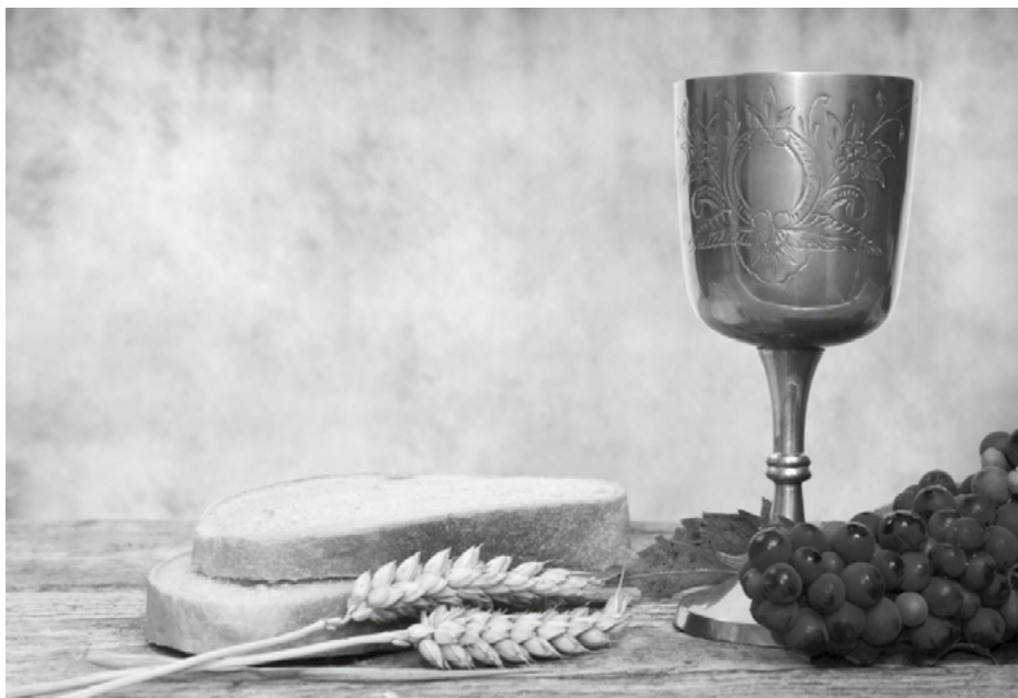
Omdat ons genade wordt verkondigd met brood en wijn worden we gevormd tot vergevingsgezinde mensen.

een toekomst die er nog niet is en die je ook niet zelf kunt realiseren.